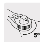
Mecanismo de 72 dientes