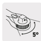
Mecanismo de 72 dientes