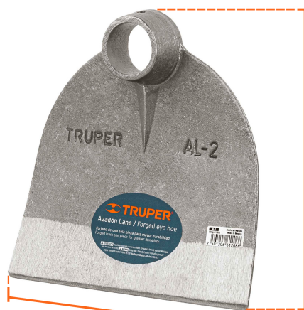
Altura de hoja 8" (20 cm)