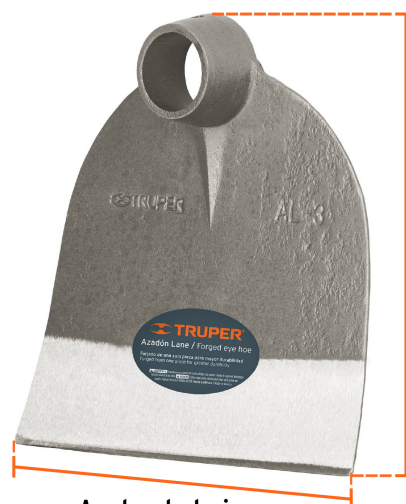
Altura de hoja 8 1/2" (22 cm)