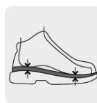
Absorción de impacto