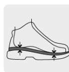
Absorción de impacto