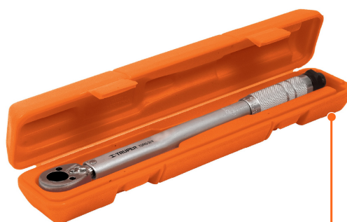
Incluye estuche plástico