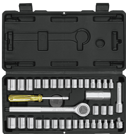
Estuche de plástico, inyectado, que mantiene las piezas organizadas