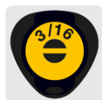
Marcado y código de color