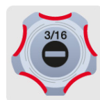
Marcado y código de color