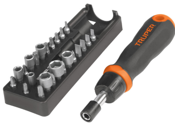
Puntas de acero al cromo vanadio