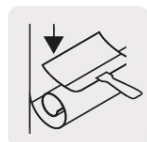
Alisado de papel tapiz