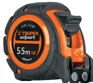
Gancho doble magnético