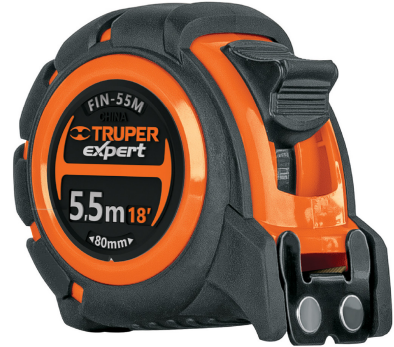
Gancho doble magnético