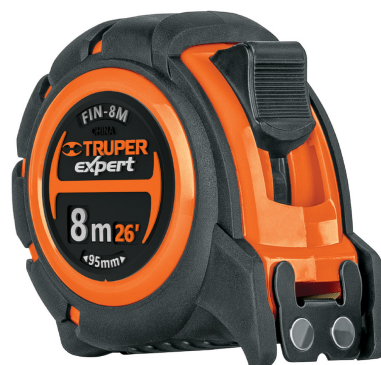
Gancho doble magnético