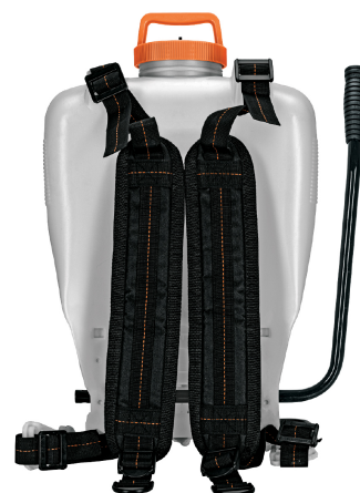
Correas ajustables y acojinadas para mayor comodidad