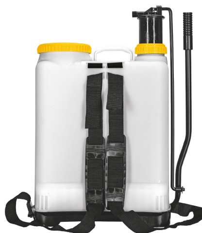
Correas ajustables para fácil transporte