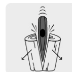
Para rajar leña y golpear otros materiales