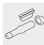
Mecanismo Rocking dog