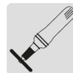
Para esmeril neumático recto (DICOF-3010)