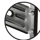
Puente Calibre 19 (1 mm espesor) Doble tornillo Brinda mayor estabilidad