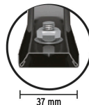
Soporte Calibre 16 (1.5 mm espesor)