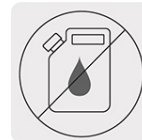
Libre de mantenimiento