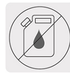
Libre de mantenimiento