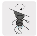
Válvula de drenado