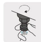
Válvula de drenado