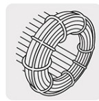
Bobinas de cobre