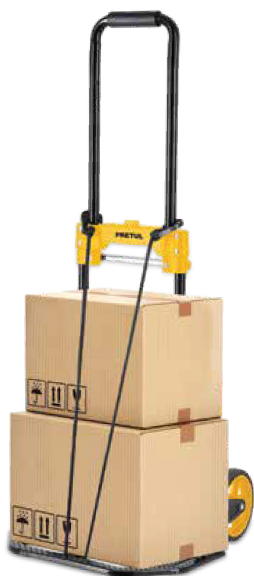
Tensor elástico para asegurar la carga