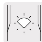
Luz LED que indica encendido