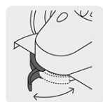
Guarda de ajuste rápido