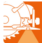
LED para iluminar