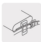
Clip para cinturón