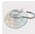
Incluye ventosa y gancho