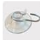
Incluye ventosa y gancho