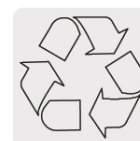
El cobre es un material reciclable