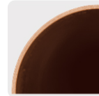
Tipo N Espesor de 0.36 a 0.56 mm