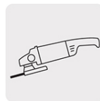
Para esmeriladora angular