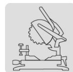
Para sierra de inglete