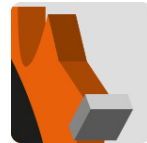
Dientes de carburo