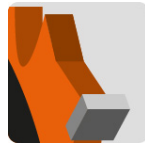
Dientes de carburo