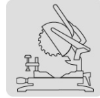
Para sierra de inglete