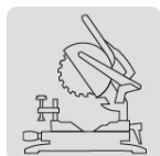
Para sierra de inglete