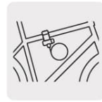
Portacandado para cuadro de bicicleta