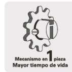
Mecanismo en 1 pieza Mayor tiempo de vida