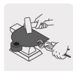
Forjados en una sola pieza