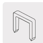
Para grapas espesor 0.6 mm