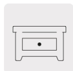
Trabajos en madera