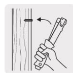
Movimiento tipo martillo