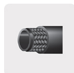
Manguera reforzada trenzada, 3 capas