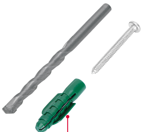
Cinturones de resistencia y anclas retráctiles de fijación