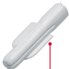
Cinturones de resistencia y anclas retráctiles de fijación