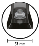
Soporte Calibre 16 (1.5 mm espesor)