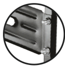
Puente Calibre 19 (1 mm espesor) Doble tornillo Brinda mayor estabilidad