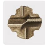
Punta de cruz