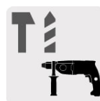
Para rotomartillos SDS Plus