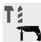
Para rotomartillos SDS Plus