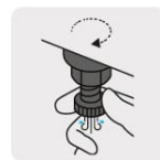
Válvula de drenado