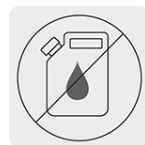
Libre de mantenimiento