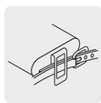
Clip para cinturón