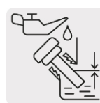
Sensor de nivel bajo aceite