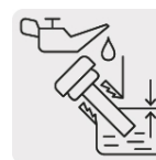
Sensor de nivel bajo aceite