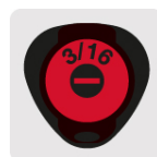
Marcado y código de color